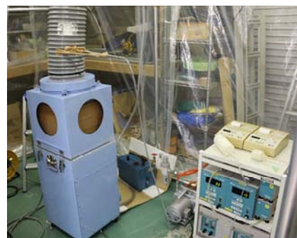
エアゾル濃度測定器による捕集効率評価作業の様子(社内検査)